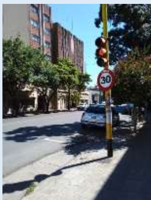
Bahía Blanca, Buenos Aires

El importante apoyo recibido a la iniciativa de Calles para la Vida y su reducción de velocidades, resultan un enorme aliciente para seguir trabajando por ella, y para pensar que las metas del nuevo Decenio Mundial para la Seguridad Mundial 2021-2030 pueden lograrse en Argentina y en el mundo, y reducir a la mitad las muertes que provoca la pandemia de los siniestros de tránsito.