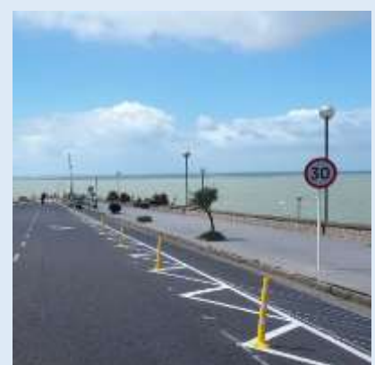
Mar del Plata, Buenos Aires